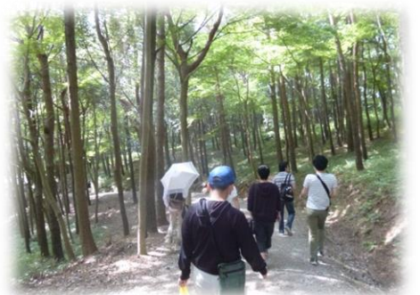
牧山(まぎやま)ハイキングでリフレッシュ！！そしてやっぱり「ジェンガ」！！