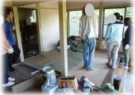
十三浜でリフォームボランティア！！