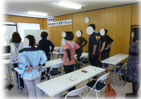
美容ダイエットセミナーに参戦！！